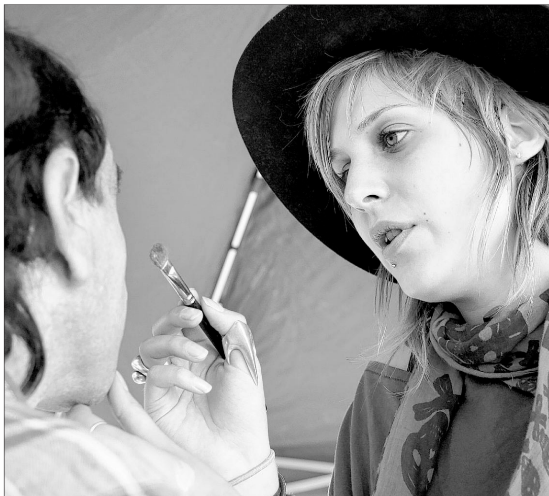
Auf dem Set wird nichts dem Zufall überlassen, schon gar nicht die Optik.